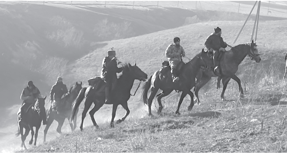
Конники посетили населенные пункты, которые в годы войны стали центрами сопротивления

Партизанское движение на Северном Кавказе отличалось особой организованностью. Уже летом 1942 года при Военном совете Северо-Кавказского фронта был создан Южный штаб партизанского движения. К сентябрю 1942 года только в Краснодарском крае действовали 73 партизанских отряда общей численностью около 6500 человек. Особенностью региона стало активное участие в сопротивлении