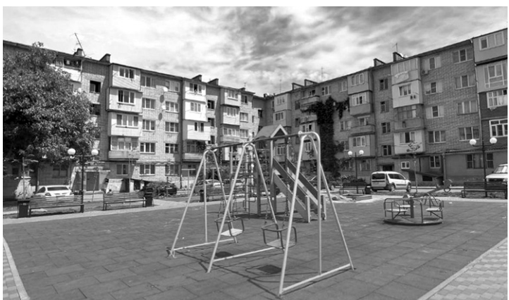
Скоро у нас появится новая должность — администратор многоквартирного дома

Помимо этого, в стране появится новая должность — администратор многоквартирного дома. В его обязанности будет входить организация собраний собственников, оформление принятых решений, а также взаимодействие с государственной информационной системой ЖКХ и управляющей компанией. Кроме