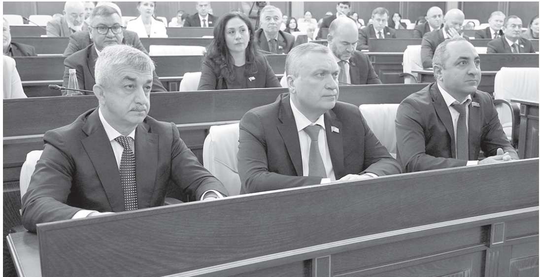
На сессии депутаты рассмотрели 20 вопросов повестки дня