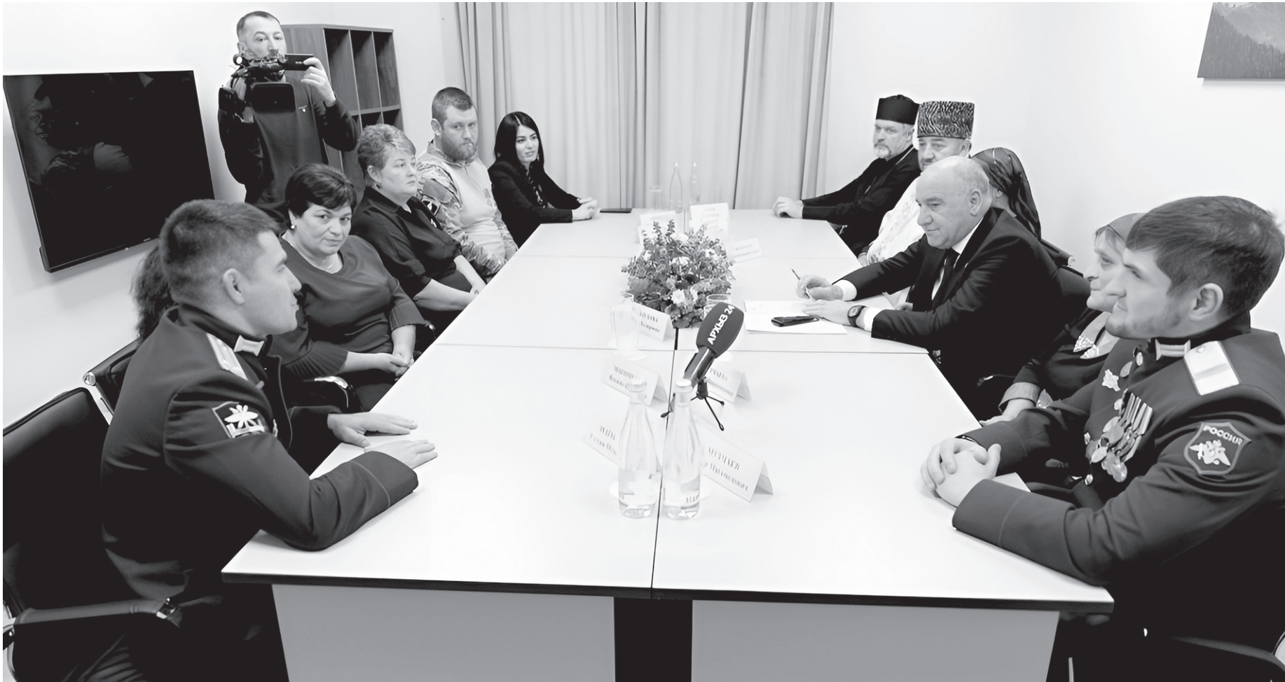
На встрече обсуждались меры социальной поддержки военнослужащих и членов их семей

Состоялся открытый диалог, в ходе которого матери героев поделились своими переживаниями, надеждами, а также рассказали о вопросах, требующих дополнительного внимания со стороны органов власти, сообщил Глава КЧР Рашид Темрезов