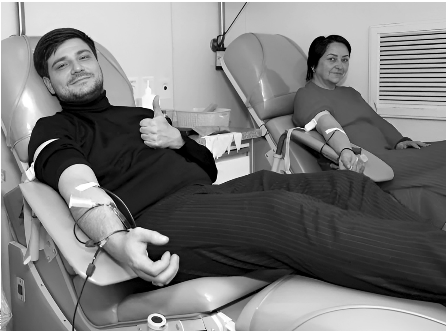
Студенты и преподаватели КЧГУ проявили большую активность в донорской акции для воинов СВО